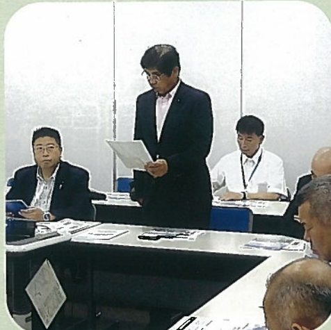
農林水産商工常任委員会 で委員長として意見調整