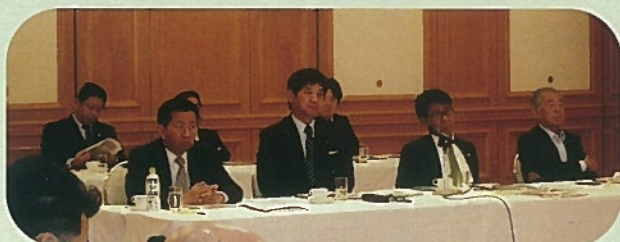
国への政策提案について県選出国會議員と意見交換