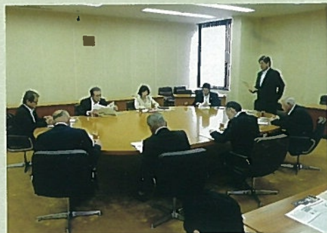
農林水産商工常任委員会 で委員長として意見のまとめ中