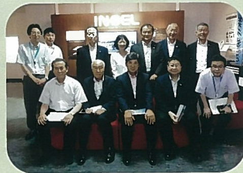
農林水産商工常任委員会のメンバーです