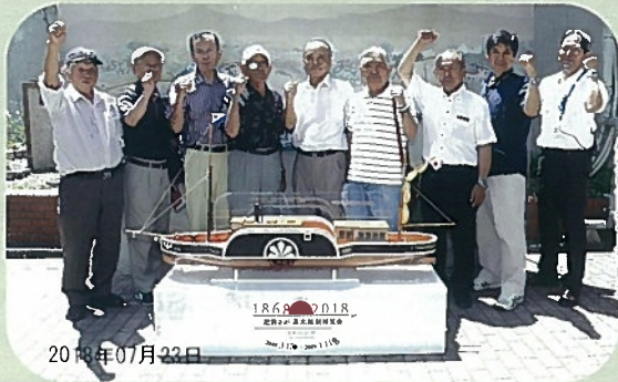
半田地区区長会。「からつ最高!!」