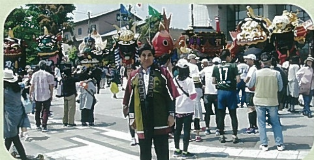
4月29日唐津神社春季例大祭 「今年の唐津くんちはすでに始まっている」