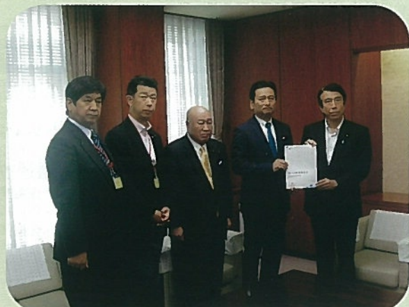
齊藤 健 農林水産大臣に要望活動