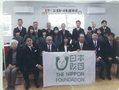
かがみこどもプラザの開所式に出ました。鏡のこども達が元気に真直ぐに育つように地域で取り組んでいます。