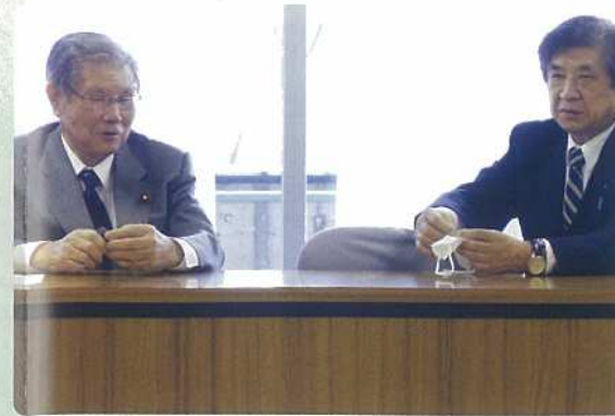
保利先生の「清潔、誠実、責任」の政治信条を受け継いで凛として、前へ進んでいきます!