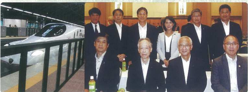
観光振興議員連盟で『九州観光振興大会』に出席 西九州新幹線も開通し、唐津市・玄海町にも沢山の人が来ていただきたい!