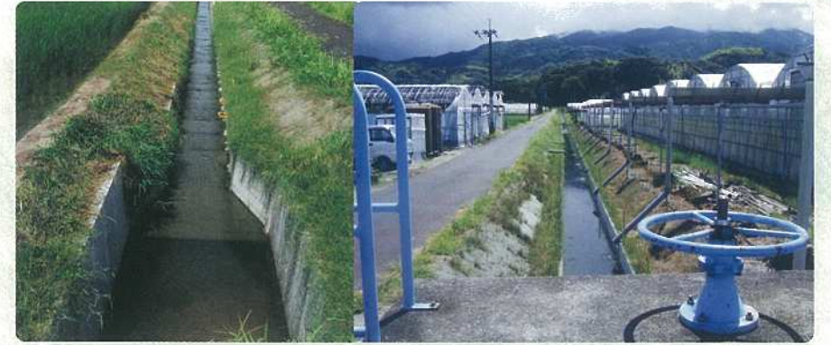
水田基盤整備事業で排水路の整備が出来ました。これから暗渠排水工事をを行います。また、「さが園芸888運動」の取り組みで稼げる農業の確立に取り組めます。