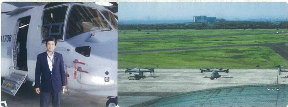
オスプレイを視察 日本の防衛と安全の為、佐賀空港使用の課題について木更津駐屯地を視察。