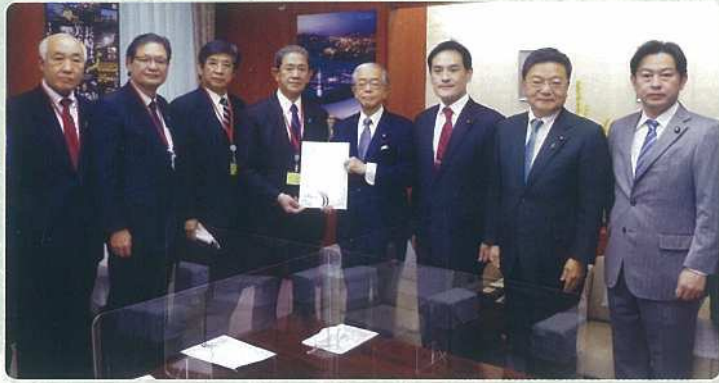
佐賀県農業・農村振興議員連盟で金子農林大臣へ要望活動